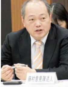
介護事業経営実態調査委員会の委員、厚生労働省が提出した平成26年度介護事業経営実態調査結果の概要(案)を大筋で了承し、介護給付費分科会に報告することを決めた。

調査結果によると、21サービスのうち収支差がマイナスになったのは居宅介護支援と複合型サービスだけ。介護老人保健施設は5.6%(前回9.9%)。厚労省は「全体として経営は安定している」と説明している。介護老人福祉施設をみると、ユニット型が8.5%でユニット型以外の8.7%を下回った。