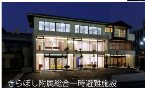
きらぼし附属総合一時避難施設