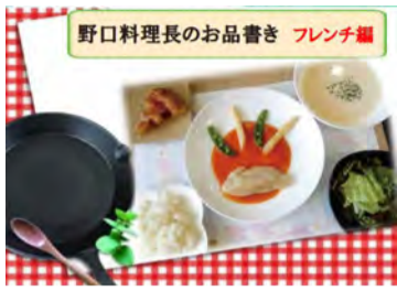
5月には旬のフレンチを提供

～「ここで暮らせてうれしい」「あなたに会えてよかった」と みんなが笑顔になれる施設でありたい～