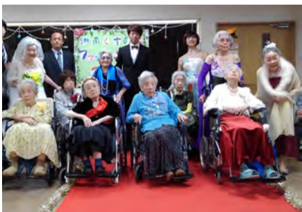
ドレスやお気に入りの服を披露