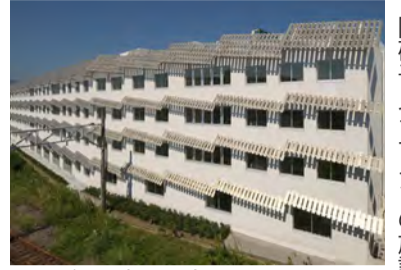
白い壁面と光のうつろいで様々な表情を見せる飾り庇

300㎡以上のエントランス 当施設は平成26年11月に国立競技場など数多くの有名な建築物を手掛ける建築家、隈研吾氏の設計により完成しました。入居のみ12ユニットの施設です。JR東海道線「鴨宮駅」から徒歩で約15分、近くに大型商業施設があるので施設を訪れた後、買い物もできます。