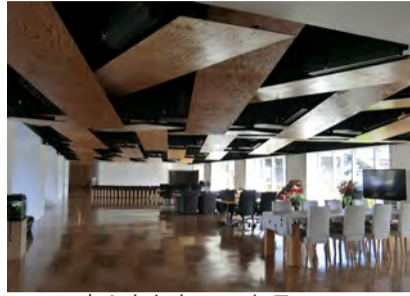
広々としたエントランス

施設のイベントだけでなく、約100人が参加する若年性認知症カフェなど、地域交流の場として利用いただいています。 安心、安全、美味しさを追求 法人の母体が崎村調理師専門学校ということもあり、入居者の皆様に「毎日の食事が