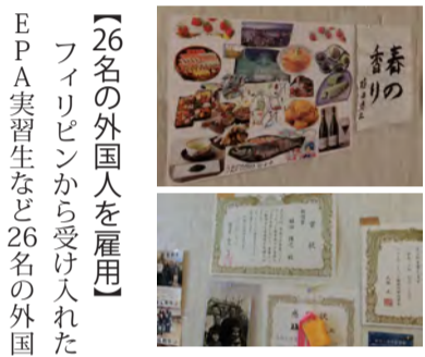
植田氏の作品と賞状

【26名の外国人を雇用】 フィリピンから受け入れたEPA実習生など26名の外国人が働いています。資格取得後結婚して家族で町で暮らしている人もいますが、来日して住宅に困らないよう施設の中に職員寮(19室・22名可)を備えています。