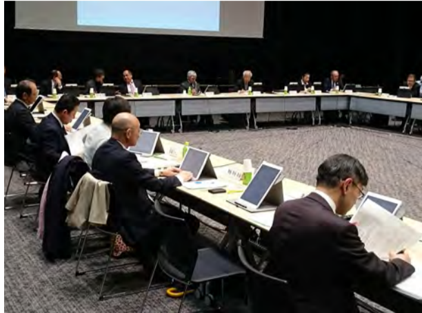
第170回介護給付費分科会(東京・港区芝)

しかし、介護職員(改善加算を取得している事業所勤務)の増加の内訳をみると、「一時金(賞与等)」が4010円で最も多く、「手当」3610円、「基本給」3230円だった。分科会から「依然として基本給引き上げに慎重な経営者が多い」と改善を求める意見が出た。