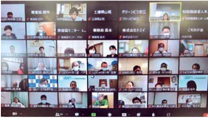
6月28日 第18回社員総会 (オンライン)