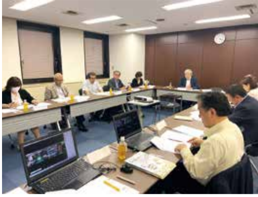
6月15日 第2回あり方検討会

会合では第1回検討会(5月26日開催)で出た主な意見として、▽ユニットケアの背景にある考え方の再確認▽ユニットリーダーの役割強化▽ユニットケアにおける環境の要素▽ユニットケア研修の対象や実施方法を見直す必要▽ユニットケアを有料老人ホームなどに広げていく▽ユニットケア施設の整備促進を図るための施策といった論点が示され、各項目について改めて議論が行われた。