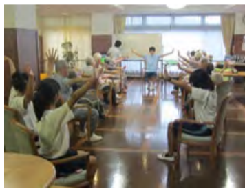
リハビリ体操を体験する生徒

8月・夏休み福祉体験学習 葉山町内の中学校生徒の福祉体験学習の受け入れを実施しています。生徒が施設職員や利用者様との交流を深めながら、リハビリ体操や配膳手伝いや入浴後の整容のサービス提供など、福祉体験をします。