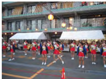
職員によるヨサコイソーラン

お寿司は常食の他に、極きざみ食も用意しています。極きざみ食は、食べやすいようにお寿司の大きさを半分にし、ネタも細かくしています。きざみ食を召し上がれない方には、お粥とお刺身を提供しています。 7月・夏祭り 職員によるヨサコイソーランや高校生によるチアダンス、地域の方々の指導による盆踊りなど数々の演目が披露されます。