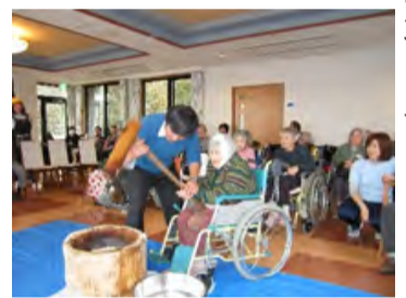
職員がサポートしてお餅つき

12月・餅つき大会 フロアごとで開催しています。利用者様ご自身で杵を持ち、掛け声に合わせて元気に餅をつきます。