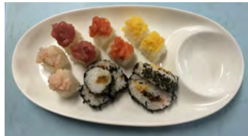
極きざみ食のお寿司

お寿司は常食の他に、極きざみ食も用意しています。極きざみ食は、食べやすいようにお寿司の大きさを半分にし、ネタも細かくしています。きざみ食を召し上がれない方には、お粥とお刺身を提供しています。 7月・夏祭り 職員によるヨサコイソーランや高校生によるチアダンス、地域の方々の指導による盆踊りなど数々の演目が披露されます。