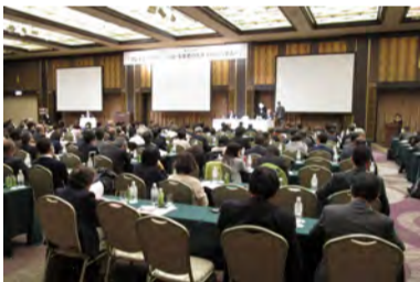
フレイル高齢者の対応を話し合う国際シンポジウム(名古屋市)

どうすれば、要介護状態の高齢者を減らせるのか。3月27日、名古屋市で「高齢者のフレイルへの対応」をテーマにした第4回国際シンポジウムが開かれた。