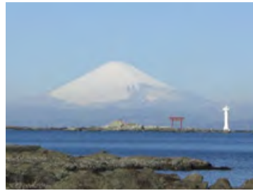
施設の目前に広がる富士山

【地域交流スペース】 施設の敷地内にある葉山交流館(高橋是清記念館)を地域交流スペースとして利用しています。