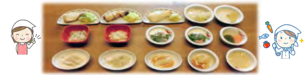
ふつう食 たべやす食 そふと食 やわらか食 なめらか食