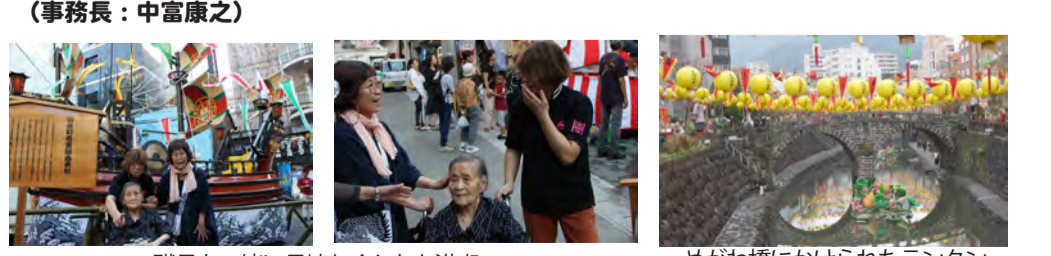
職員と一緒に長崎おくちを満喫